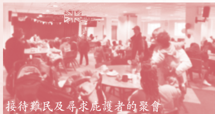
接待難民及尋求庇護者的聚會

難民事工 我們事奉的其中一個平台是接觸難民及尋求避護身份來英國的群體，透過開放場地提供一些日常生活物資及食物來歡迎他們，以及提供諮詢及援助，聆聽及與他們同行。他們當中有來自中東封閉國家，也有來自非洲，南美洲等不同族裔的朋友。每一個都帶著不同的故事：在故鄉面對不同程度的困苦與逼迫，以致撇下所有來到英國，尋覓他們能安心的避難所。我們期盼能