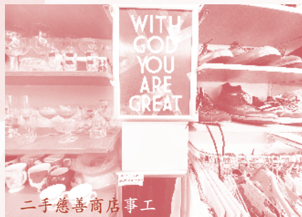
二手慈善商店事工

二手慈善店 英國是一個多元文化的國家，在我們身處的城市有些地區是穆斯林社群高度集中的區域，我們主要事奉是在伊斯蘭社區，透過經營二手慈善店（Charity Shop）來接觸街坊與他們建立友誼。感謝主，今年這店已踏入第十個年頭，也獲得社區及顧客的認同，顧客們都很喜歡我們的店，有些每天都來逛逛，來尋找心頭好；也有些是主動來跟我們聚聚閒談，除分享生活的日常，也有機會與他們有宗教對話。在這店工作讓我們與