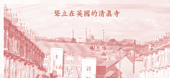
聳立在英國的清真寺